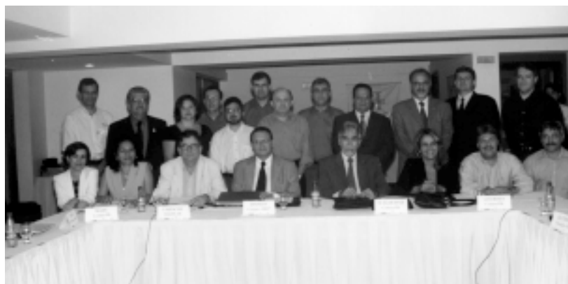
Participantes do 86.º Encontro de Diretores Técnicos das afiliadas da Abep

de diversos órgãos do governo, conferindo-lhes transparência administrativa, agilidade e qualidade. Outra vantagem é a produtividade. A unificação otimiza processos, elimina duplicações e simplifica procedimentos.